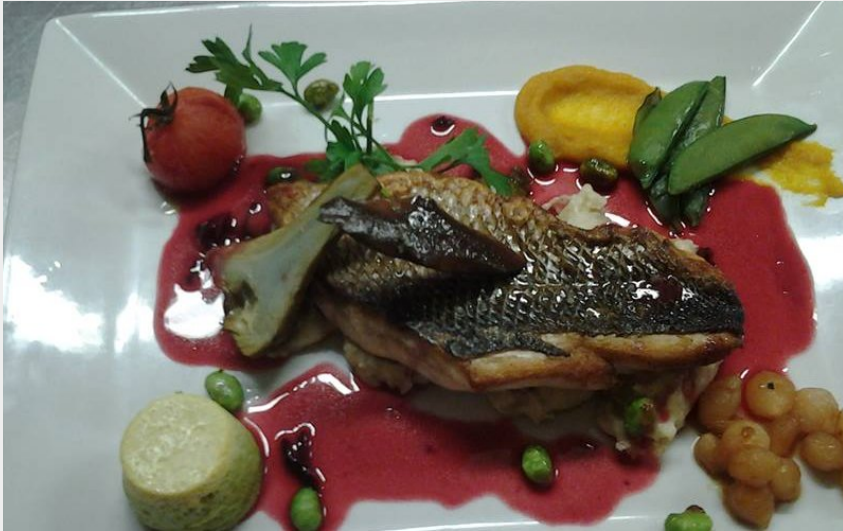
Crédit : Assiette du restaurant Entre Terre et Mer (Entre Terre et Mer)