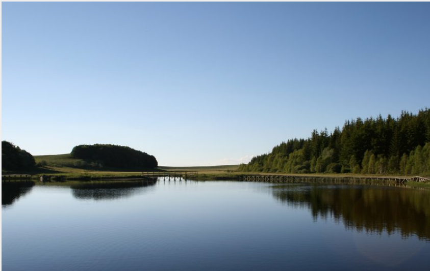
Crédit : Le Lac de Bonnetombe (Office de Tourisme de l'Aubrac aux Gorges du Tarn)