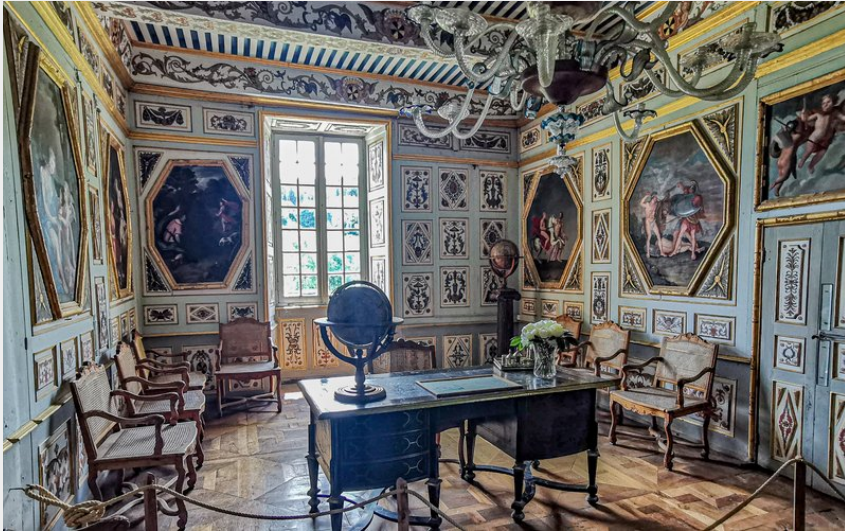
Crédit : Bureau de César - Château de la Baume (© Conseil départemental - Laura Saint-Léger)