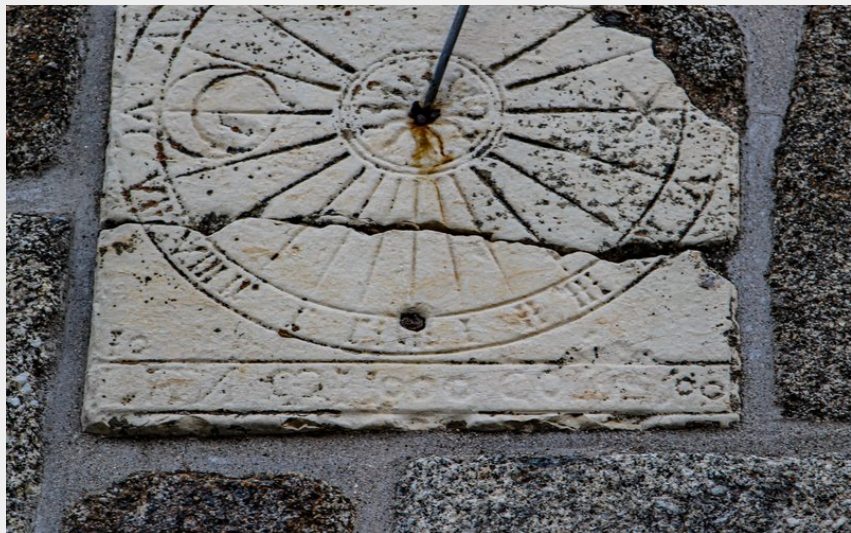
Église Nasbinals - cadran solaire