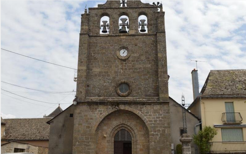
Crédit : Eglise Saint-Germain-du-Teil (Roxane Carrat - Conseil départemental Lozère)