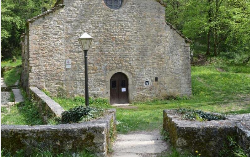
Crédit : Chapelle Saint-Frézal (Roxane Carrat - Conseil départemental Lozère)