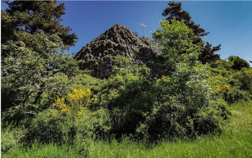
Crédit : Roc de Peyre - vue générale (© Conseil départemental - Laura Saint-Léger)