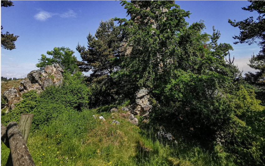
Crédit : Château Arzenc d'Apcher (© Conseil départemental - Laura Saint-Léger)