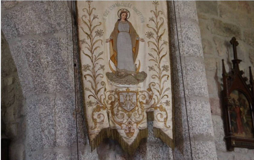
Bannière - entrée du chœur