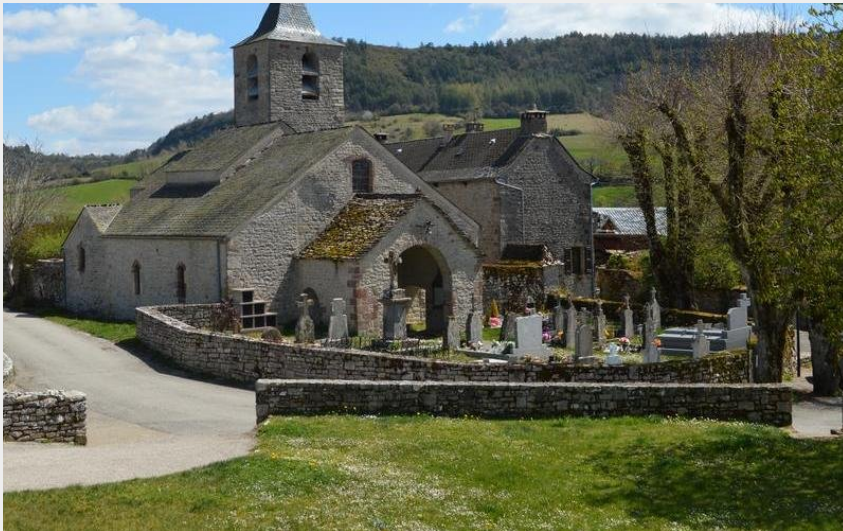
Crédit : Eglise de Canilhac (Roxane Carrat - Conseil départemental Lozère)