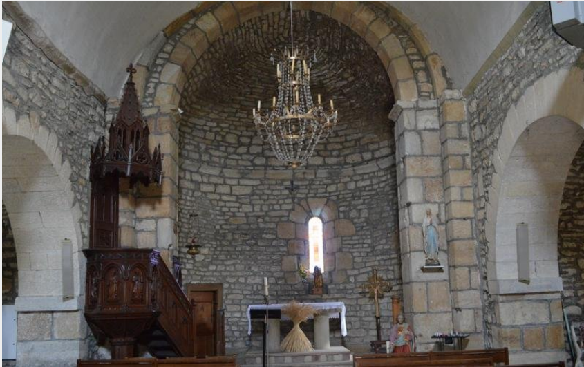
Crédit : Eglise de Montjézieu - Intérieur (Roxane Carrat - Conseil départemental Lozère)