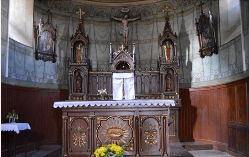
Eglise d'Auxillac - chœur