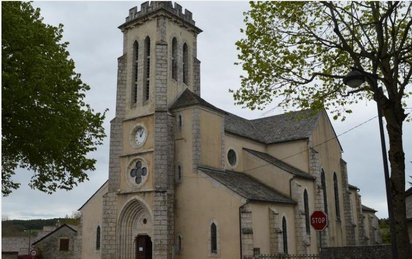
Eglise Saint-Martin du Masegros