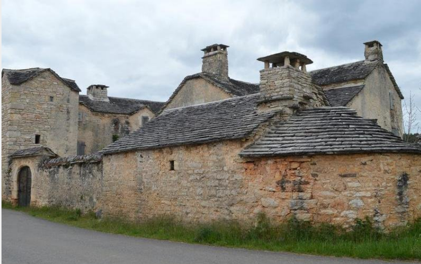
Crédit : Ferme aux Monziols (Roxane Carrat - Conseil départemental Lozère)