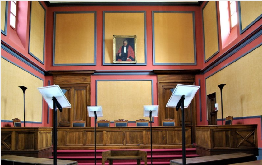
Crédit : Ancienne salle d'audience avec le portrait de Charles Julien Ignon conseiller de (archive)