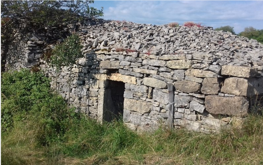
Le Plateau de La Cham