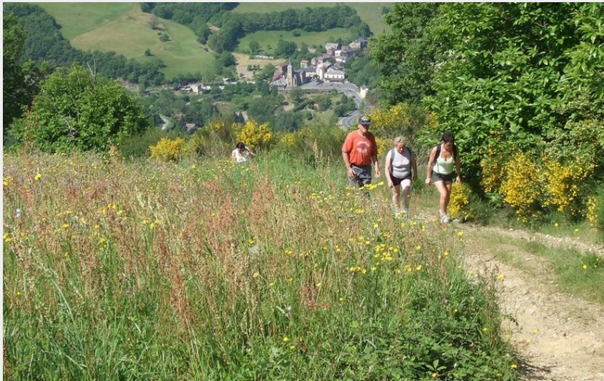
vue vers Bajaguet (OT Rougier Aveyron Sud)