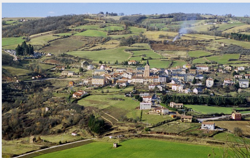
Broquiès village (Pol BOUSSAGUET)