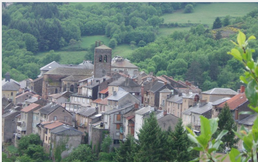
vue de St Sernin sur le sentier (OT RAS)