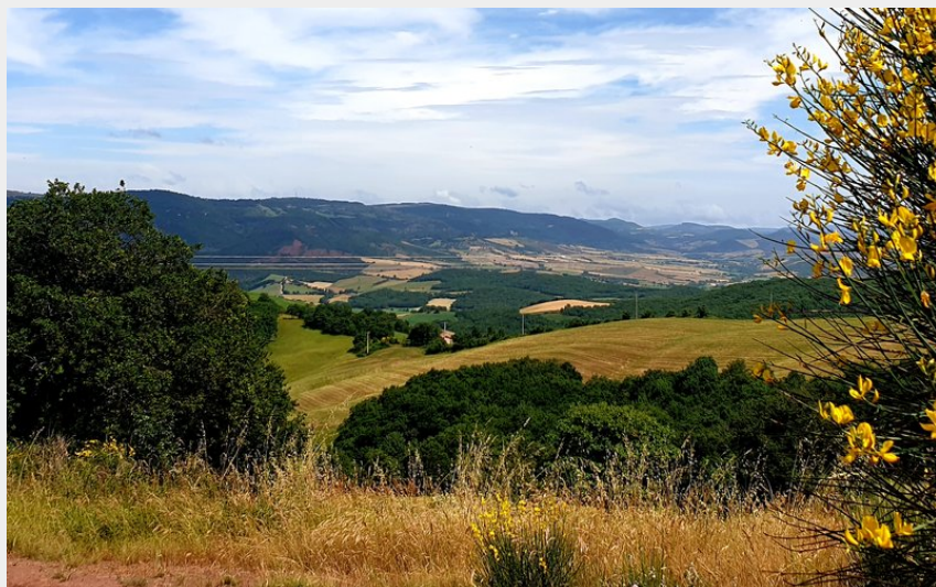
Vue vers la vallée du Dourdou