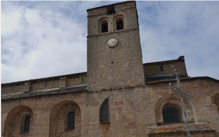
Castelnau-Pégayrols (OT MUSE ET RASPES)