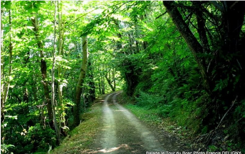
Balade autour du Bosc (Francis Deligny)