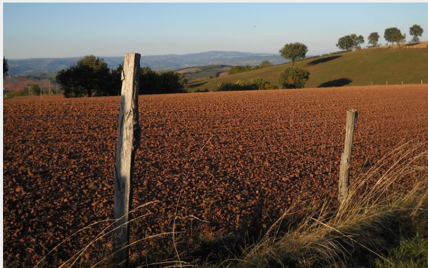
(OT Rougier Aveyron Sud)