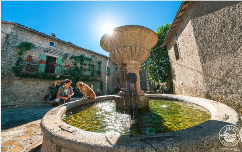
Sauclières, sa place, sa fontaine...