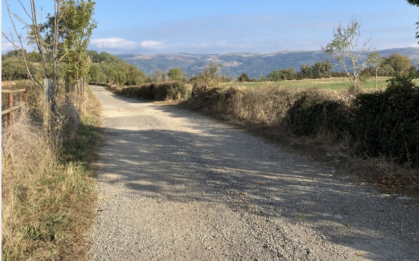
Point de vue sur la Vallée du Lot