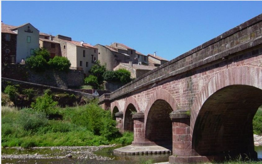
Pont de Montlaur (OT Camarès)