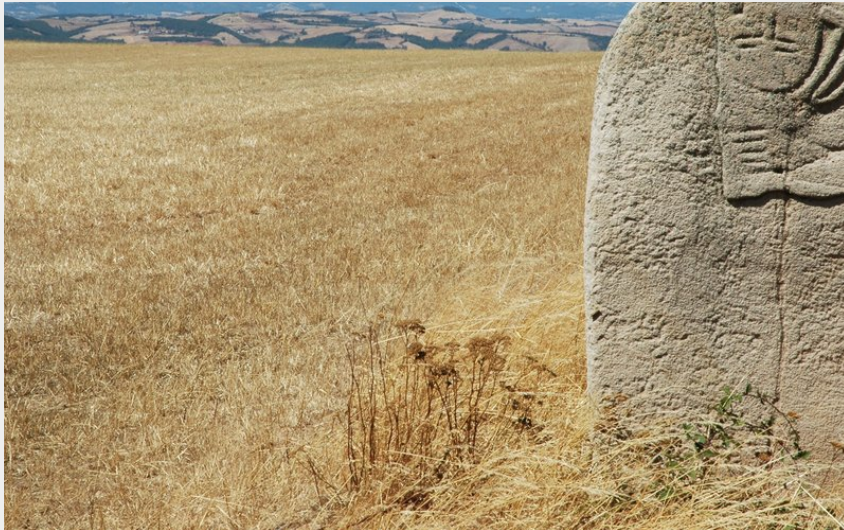
Statue-Menhir du Plo du Mas Viel