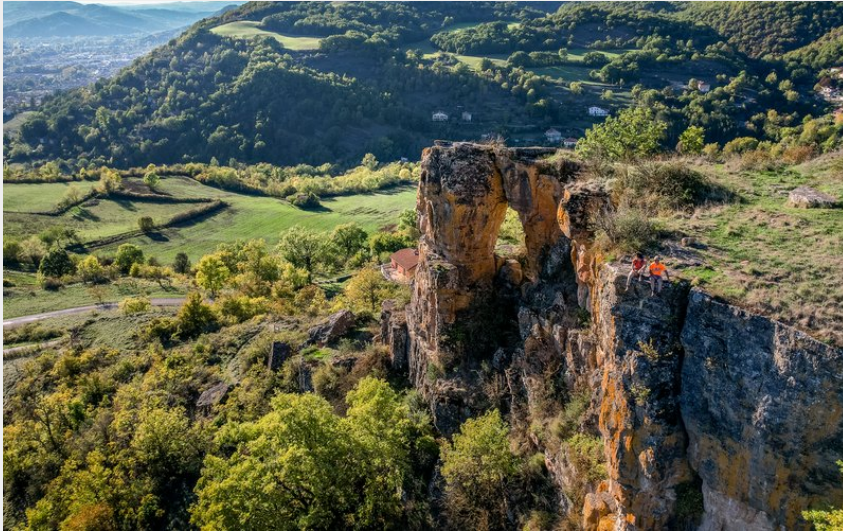
Rocher de Caylus (Virginie Govignon)