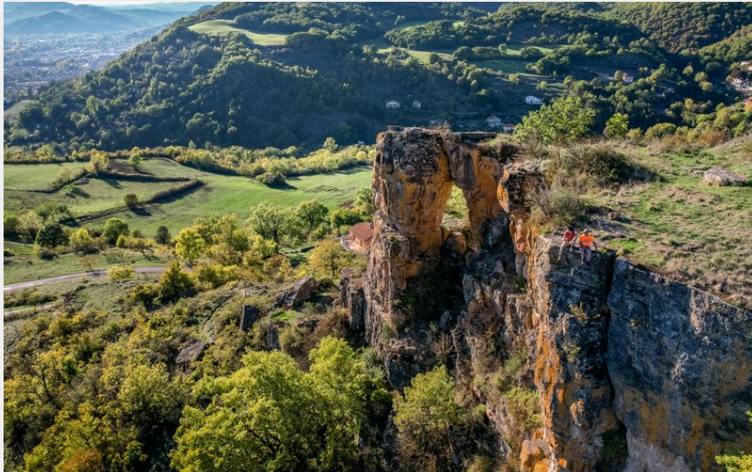
Rocher de Caylus (Virginie Govignon)