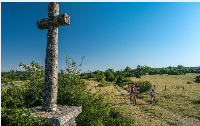
La croix de Cazejourdes