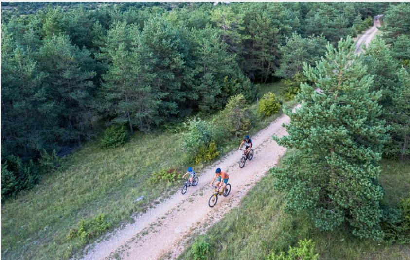
Sur le plateau du Larzac