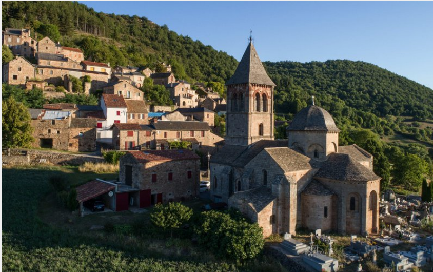
Village de Montjaux (Dominique SERIN)