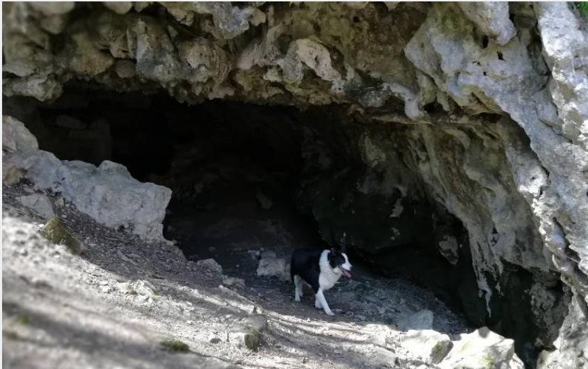
Grottes des dragonnières (Daniel Auriol)