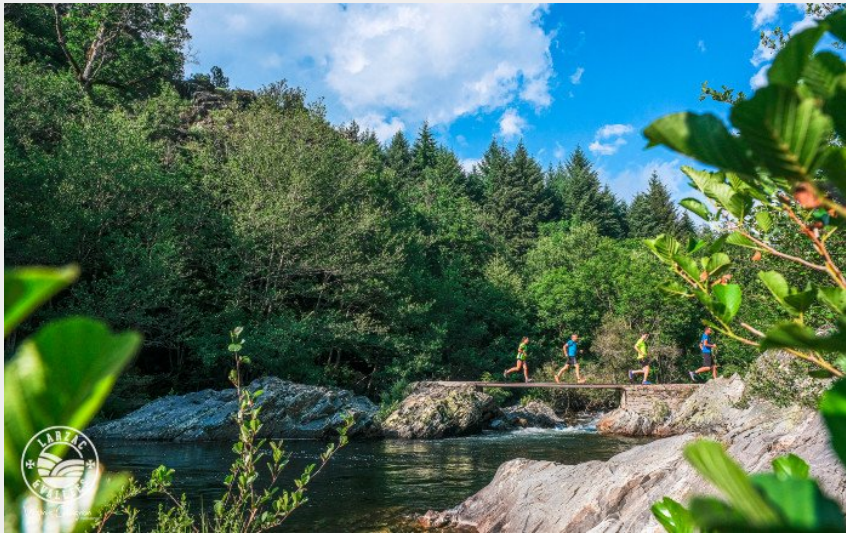
La passerelle du Tayrac