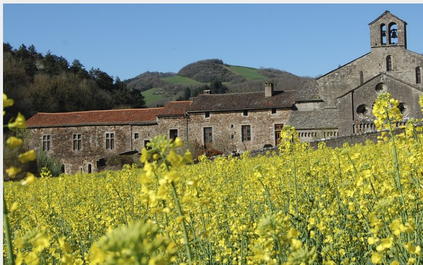
Abbaye de Sylvanès (OT Rougier Aveyron Sud)