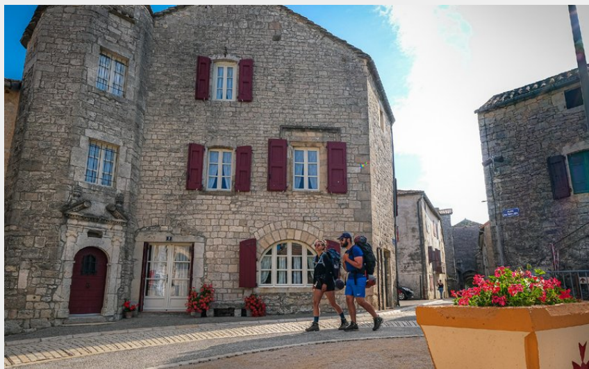
Dans le village templier de La Cavalerie