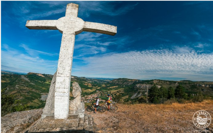
Le panorama depuis la croix de Gréponac (Virginie Govignon - OT Larzac et Vallées)