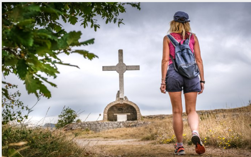
La croix de Gréponac