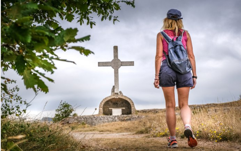
La croix de Gréponac