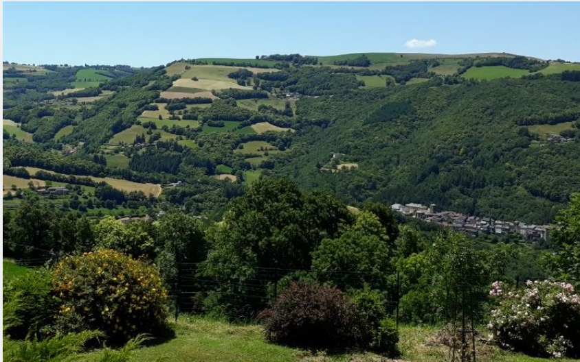
Sur les hauteurs de St Sernin (Nespoulous)