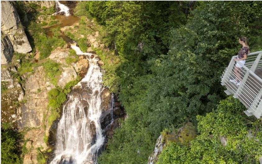
Le Saut du chien baigné de soleil