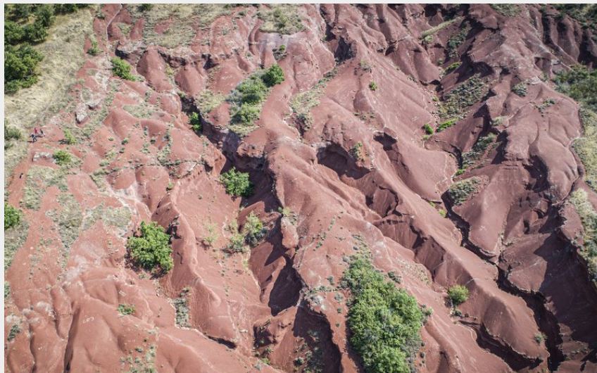
Les canyons du Rougier (Steloweb)