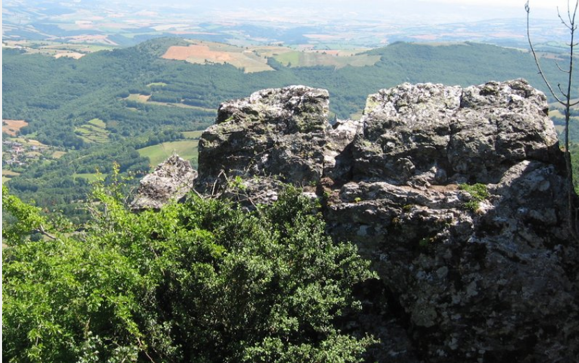
(OT Rougier Aveyron Sud)