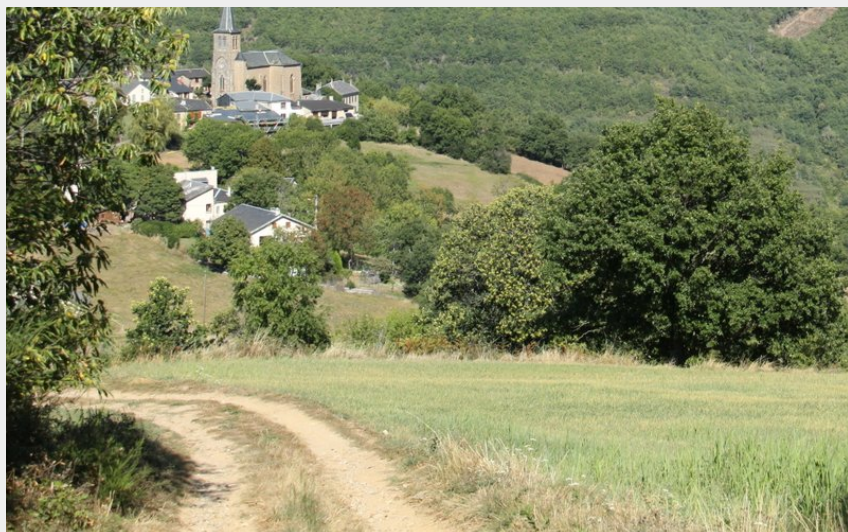
Vue sur St Crépin