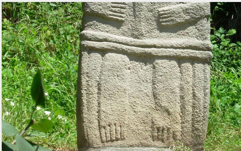
Dame de St Sernin (ElodieGenty)