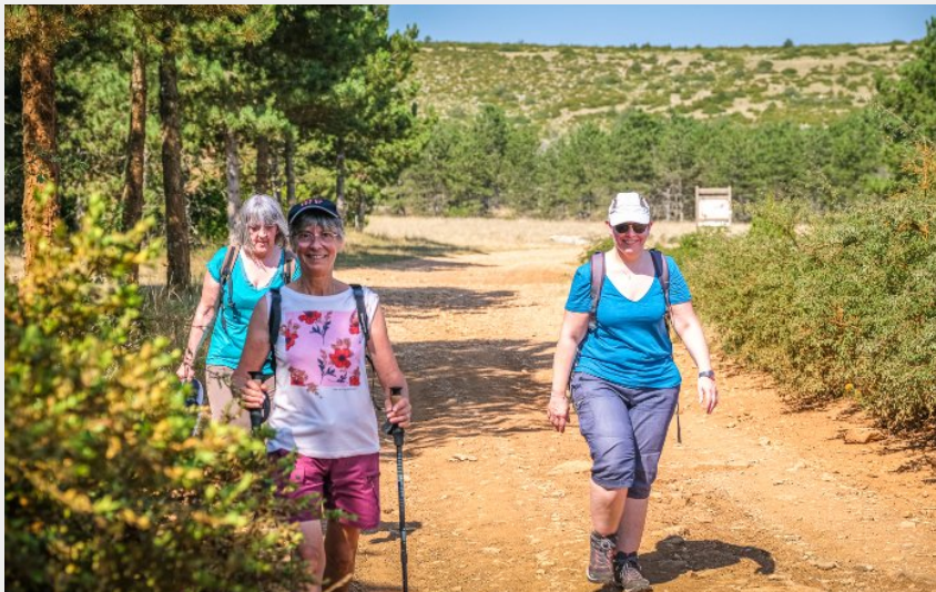
Sur le GR71 D...