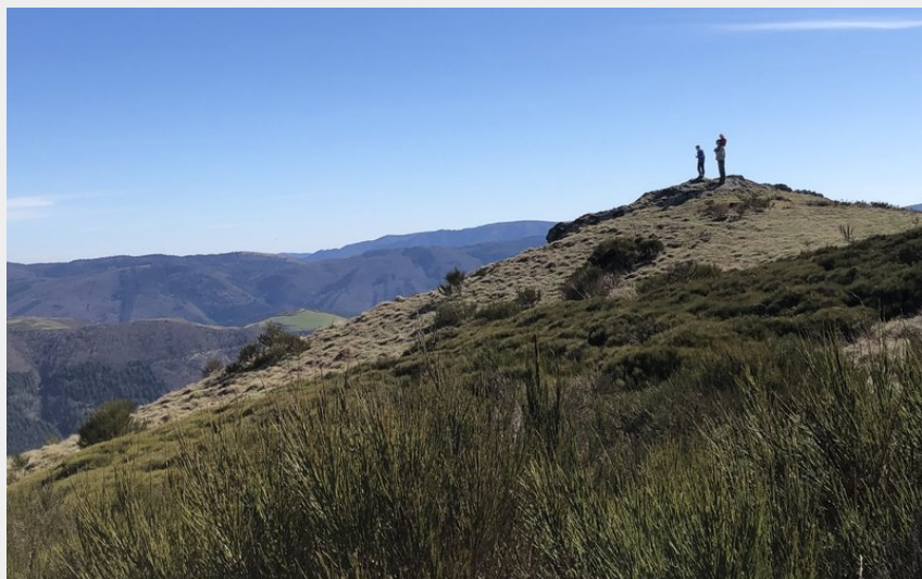
Sommet du Merdelou (OT RAS)