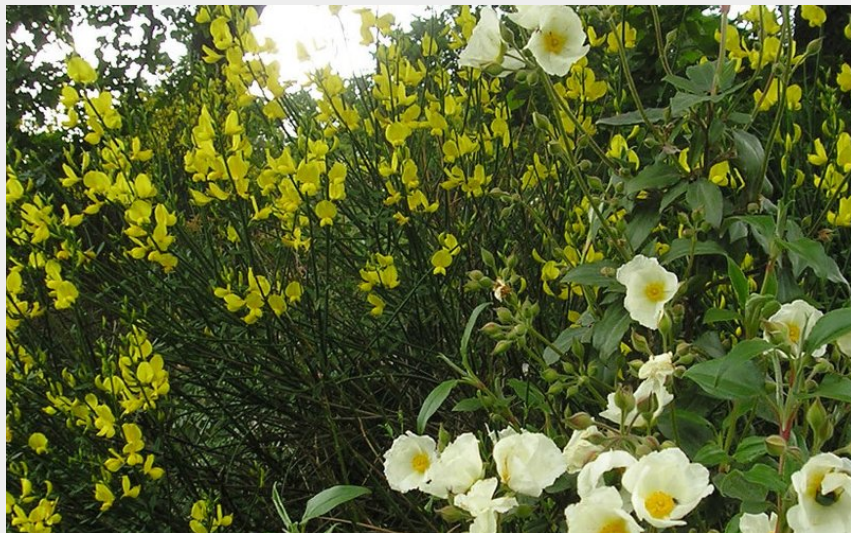
Genêts et Ciste (OT RAS)