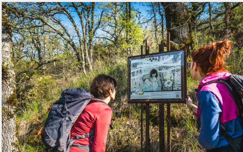
Voie romaine (V.Govignon)