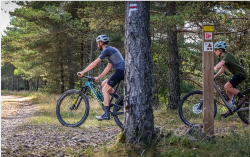
Forêt domaniale du Causse du Larzac