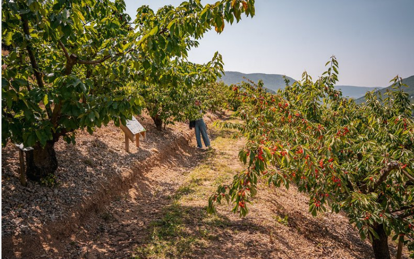
Le verger conservatoire (EnzoPlanes)